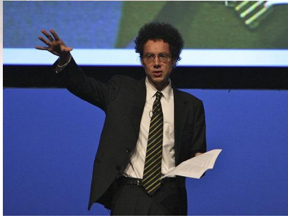
Malcolm Gladwell

Malcom Gladwell se presenta así en su blog: "I'm a writer for the New Yorker magazine, and the author of two books, " The Tipping Point: How Little Things Make a Big Difference " and " Blink: The Power of Thinking Without Thinking ." I was born in England, and raised in southwestern Ontario in Canada. Now I live in New York City.